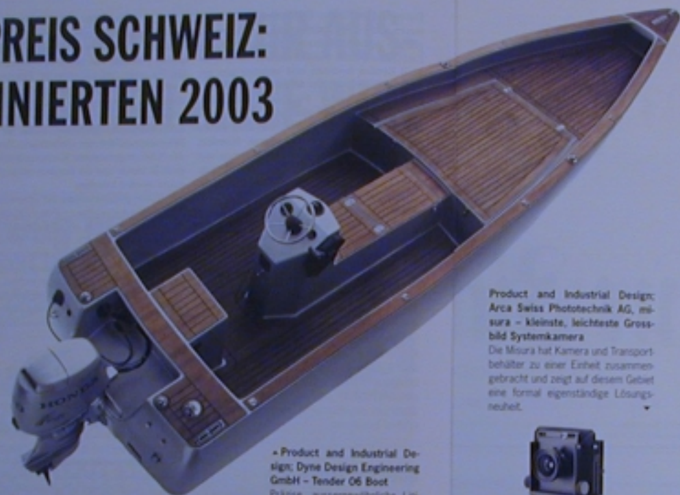
Product and Industrial Design; Dyne Design Engineering GmbH - Tender 06 Boot Präzise, aussergewöhnliche Linseneinführung, Funktion auf das Wesentliche reduziert, erstklassig materialisiert und verarbeitet. Das Boot setzt ein Zeichen und vermittelt eine sehr hohe Wertigkeit.