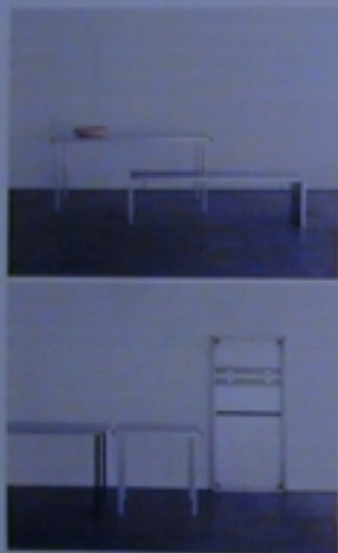
Product and Industrial Design; Lehn AG - Aluminium-Tisch 2; Neue Verformung

Der Tisch überzeugt durch seine Klarheit und Perfektion in der Verarbeitung. Das Aluminium erhält durch die verwendete Verformtechnik eine optimale Stabilität. Folge davon sind minimales Gewicht, maximale Stabilität und maximale Einfachheit.